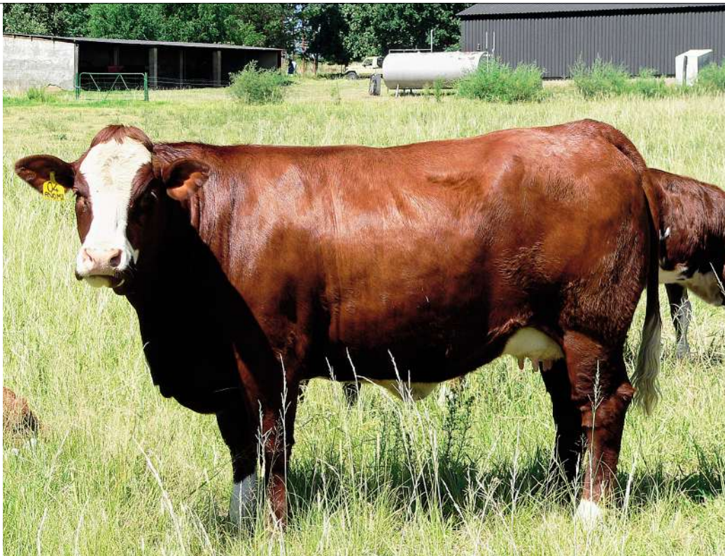
BO: So lyk die tipiese Simmentaler-stoetkoeie wat besonder goed presteer op Braklaagte.

het hy ernstig nagedink. “Ek het toe 4 000 ha gesaai. Wat is die volgende stap? Daar was berge mielies, die prys was af, die wêreldmarkte was nog nie so toeganklik soos nou nie. Graan SA het aanbeveel dat boere 30% minder mielies moes plant.