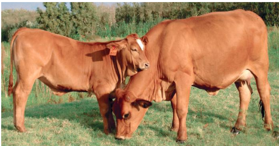
ONDER: Die koeie VLB06106B het op twee jaar oud die eerste keer gekalf. Sy het verlede September haar agtste kalf gehad en het ’n tussenkalfperiode van 365 dae.

synchroniseer, ge-KI en dan by opvolgbulle gesit. Hul dekyd is ook twee weke korter as dié van die koeikuddes. Koeie wat later in hul lewe oorslaan, word uitgeskot en kry nie ’n tweede kans nie.