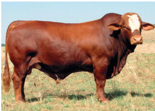
LINKS: Vlensburg Tarka (VLB09108B) is ’n welbekende bul wat Hennie self geteel het. Die bul het in 2009 die Prosim-bultoets vir Simbras gewen. Tarka het ’n uitsonderlike bouvorm en teelwaardes. Hy is tans ’n rasleier met Breedplan-teelwaardes vir geboorte- en spengewig.

Die dekyd vir ál die vroulike diere is van Desember tot middel Februarie, maar die verse word twee weke vóór die koeie ge-