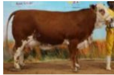
Bo: Lekkervleis Babara