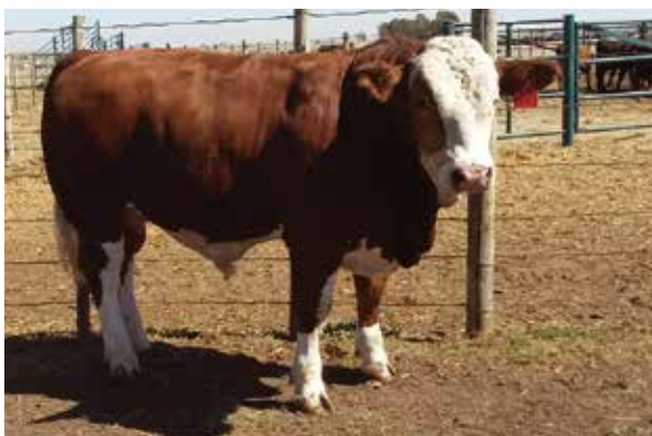
'n Voerkraal kan addisionele wins genereer deur Simmentaler-diere 56 dae langer as die normale voerperiode te voer.

was R2,55/kg voer vir week 1-6, R2,80/kg voer vir week 7-15 en R2,90/kg voer vir week 16-30. Die karkasprys was R35/kg.